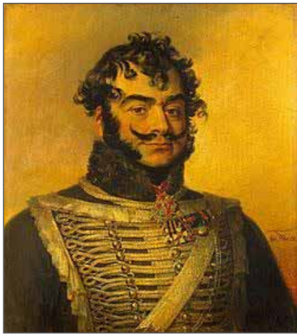
Д.А. Делянов. При Бородине командовал Сумским гусарским полком. Художник Д. Дю. Военная галерея Зимнего дворца, Государственный Эрмитаж (Санкт-Петербург).