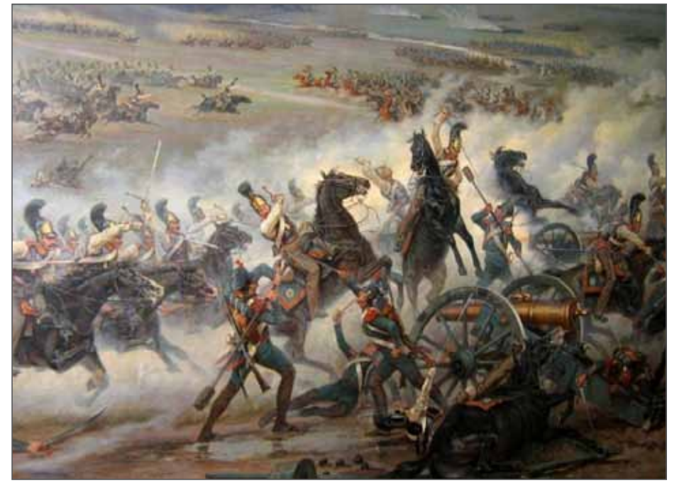
Атака Шегардинского редута. Литография по рисунку Н. Самокиша

Героями Отечественной войны 1812 года стали и десятки армян. Среди